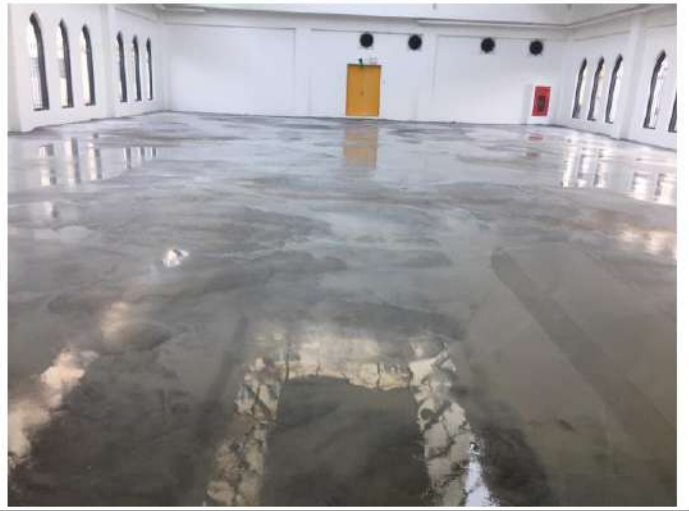
Tách nước khi thi công