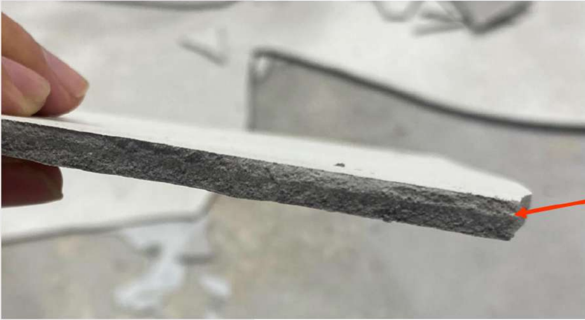
Sự tách lớp của vật liệu sau ninh kết

Quá nước dẫn đến việc sa lắng cốt liệu, tách polymer và phụ gia nổi trên mặt, giảm độ bám dính với mặt nền.