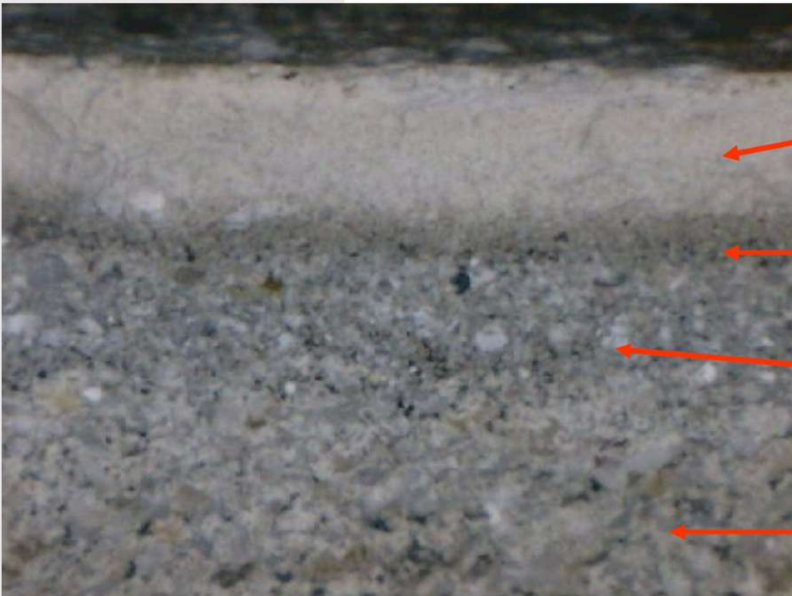
Polymer và phụ gia