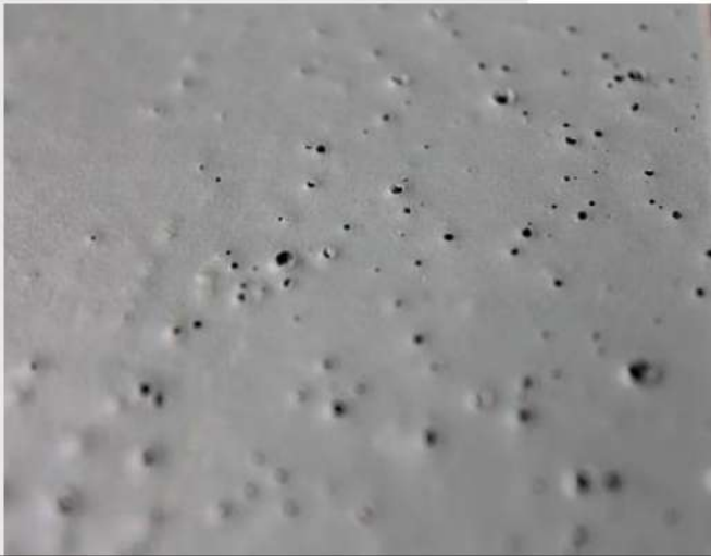
Lỗ kim sau khi khô